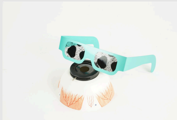
Симуляционные очки и полуоболочка глаза

Снимайте очки снова и снова, чтобы увидеть разницу.