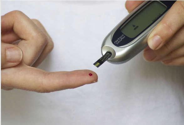
Анализ крови на глюкозу

Диабетическая ретинопатия - это заболевание глаз, которое может возникнуть у человека, страдающего диабетом. Если у человека диабет и сахар в его крови слишком высок в течение длительного времени, это может привести к повреждению мелких кровеносных сосудов в глазах. В результате у человека могут возникнуть проблемы со зрением, такие как помутнение зрения или даже слепота. Регулярные осмотры глаз очень важны для раннего выявления и лечения этого заболевания, чтобы вы могли продолжать хорошо видеть.