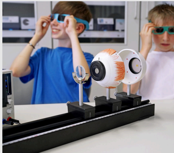
Модель глаза и симуляционные очки

>> Моделирование диабетической ретинопатии <<