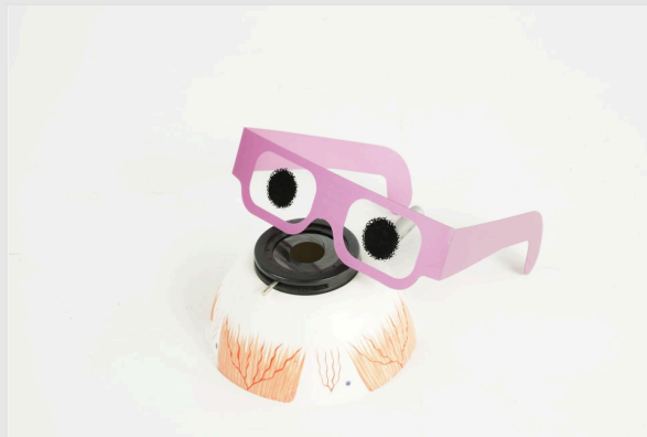
Симуляционные очки "Возрастная макулярная дегенерация" и полуоболочки глаза

Продолжайте снимать очки, чтобы увидеть разницу.