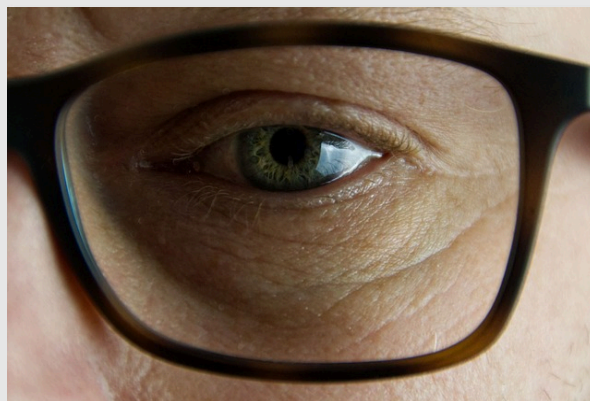
Глаз в очках