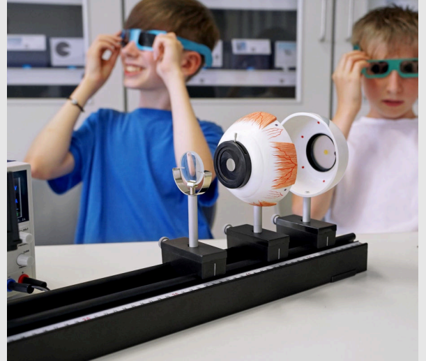
Модель глаза и симуляционные очки

>> Моделирование возрастной макулярной дегенерации <<