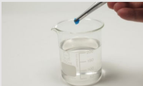
Рис. 2: Добавление кристаллов соли