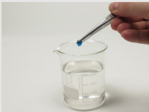
Создание "химического сада"