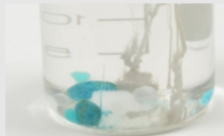
Рис. 3: Рост "химического растения"