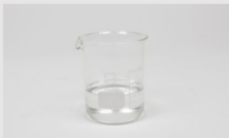
Рис.1: Раствор силиката натрия

Возьмите раствор силиката натрия (рис. 1) и используя пинцет, осторожно добавьте в раствор более крупные кристаллы соли (рис. 2). При необходимости опустите его ко дну мензурки стеклянной палочкой. Поочередно добавляйте в раствор кристаллы других солей, следя за тем, чтобы они не были рядом друг с другом (рис. 3).