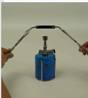
Пластмасса, помещенная над горелкой Рис.1