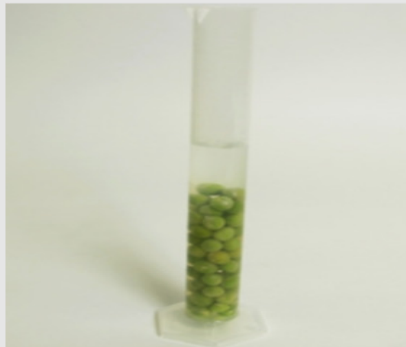
Измерение уровня воды