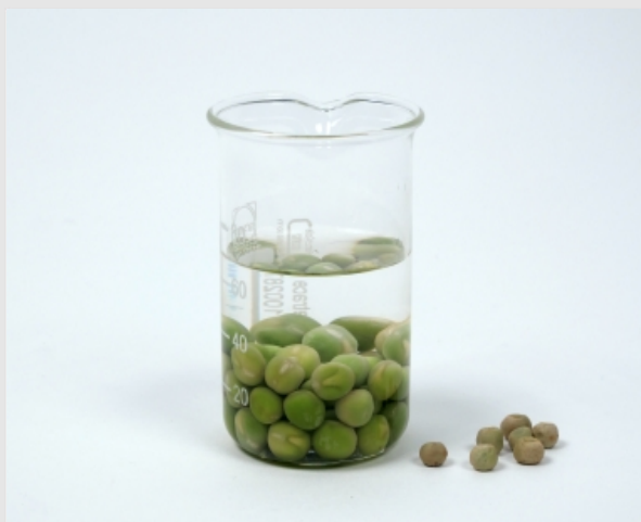
Экспериментальная установка для набухания гороха

Набухание обычно определяется как поглощение жидкости или пара набухшим телом при увеличении его объема. Набухание - это чисто физический процесс, который также можно наблюдать, например, когда желатин замачивают в воде. Тем не менее, семена, высушенные на воздухе, содержание воды в которых обычно составляет около 5%, разбухают при контакте с водой. Это также чисто физический процесс, в котором метаболизм семян не участвует напрямую. Например, пустые семена, которые уже мертвы и больше не прорастают, набухают так же хорошо, как и те, которые прорастают.