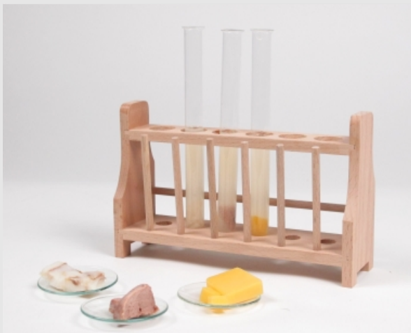
Montaje del experimento

En el intestino, el alimento ya predigerido continua su etapa de digestión y finalmente los nutrientes son absorbidos a través de la pared intestinal. Las enzimas que intervienen en la digestión del bolo alimenticio en el intestino son producidas por el páncreas y liberadas en el duodeno como jugo pancreático. El jugo pancreático contiene lipasas (enzimas que dividen la grasa), amilasas (enzimas que dividen el almidón) y proteasas (enzimas que dividen las proteínas).