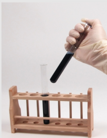
Sellar las gafas con el pulgar