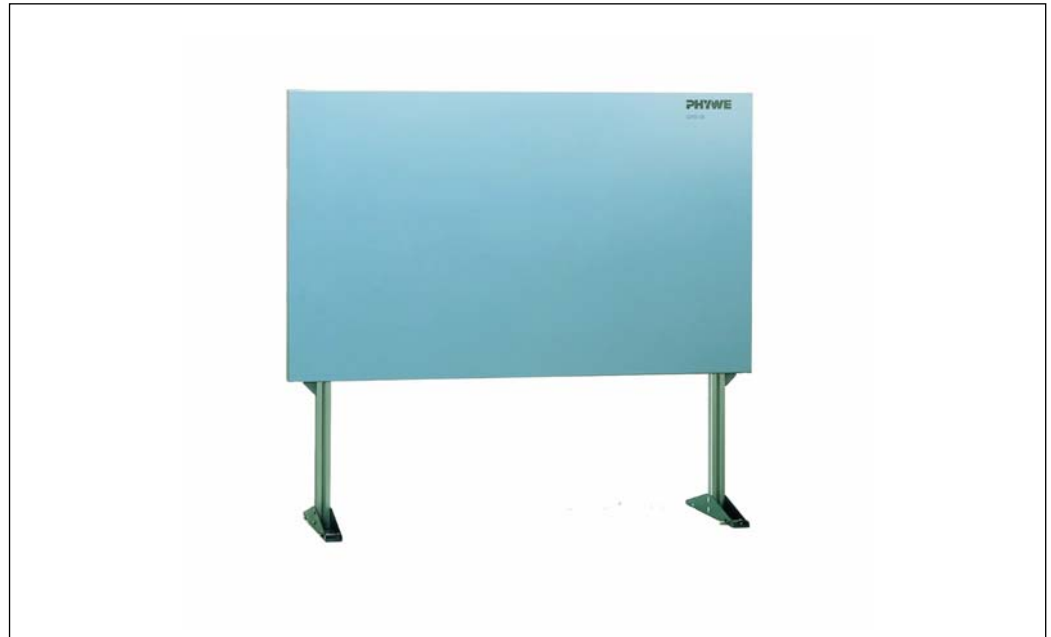
Abb. 1: 02150-00 PHYWE Hafttafel mit Gestell