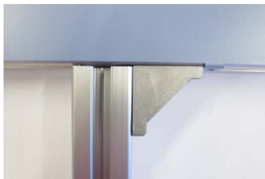
Abb.3: Befestigung des Stellfußes an der Hafttafel