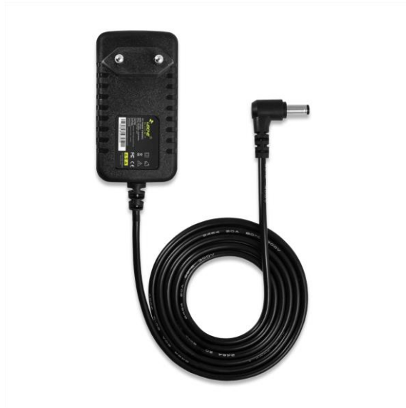
Abb. 1: Netzgerät 5 VDC/2 A, 08770-99