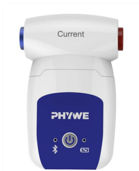
Abb. 1: 12902-02 Cobra SMARTsense Current \pm 1 A

Das Gerät entspricht den zutreffenden EG-Rahmenrichtlinien