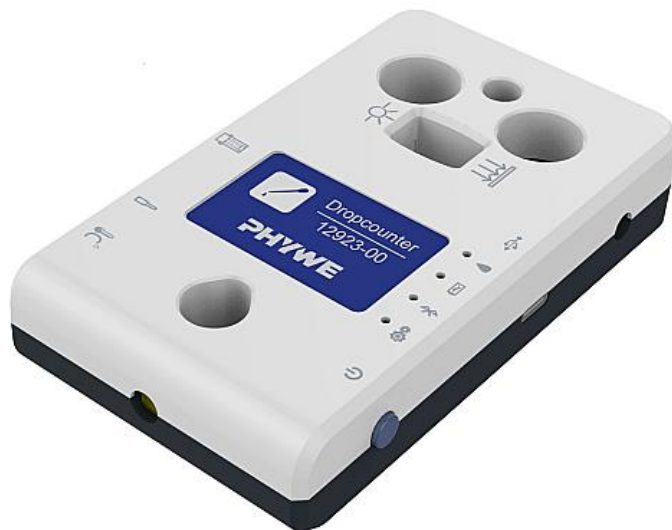
Abb. 1: 12923-00 Cobra SMARTsense Dropcounter

Das Gerät entspricht den zutreffenden EG-Rahmenrichtlinien