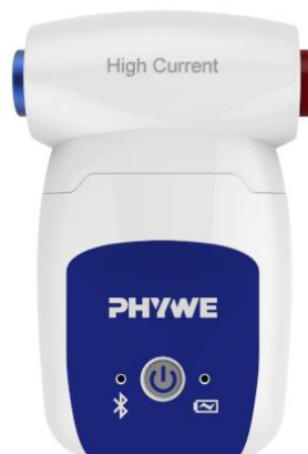
Abb. 1: 12925-00 Cobra SMARTsense High Current \pm 10 A