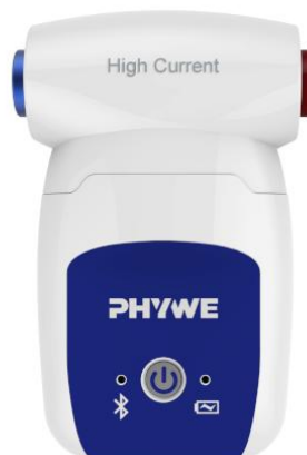
Abb. 1: 12925-02 Cobra SMARTsense High Current \pm 10 A