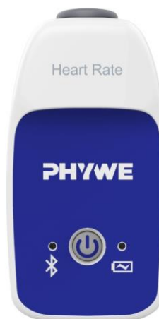
Abb. 1: 12935-01 Cobra SMARTsense Heart Rate

Das Gerät entspricht den zutreffenden EG-Rahmenrichtlinien