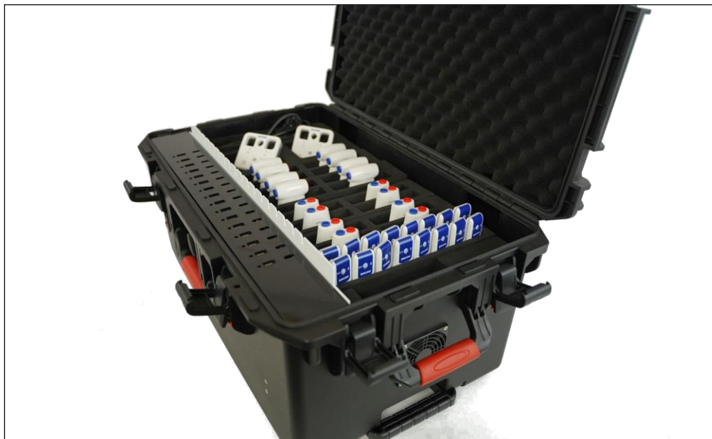
Abb. 1: SensorCase Cobra SMARTsense (Abgeb. Sensoren entsprechen nicht dem Lieferumfang)